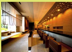
会席茶屋 菊泉(さくいずみ)

・熊本市内では唯一となる、湯量豊富で泉質が自慢の温泉ホテル ・駐車場は400台・菊南温泉スパリゾート「あがんなっせ」を併設。