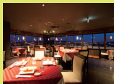
中華料理 星華楼(せいかりゅう)