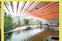
菊南温泉スパリゾート あがんなっせ