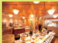
自然食レストラン ナチュラ